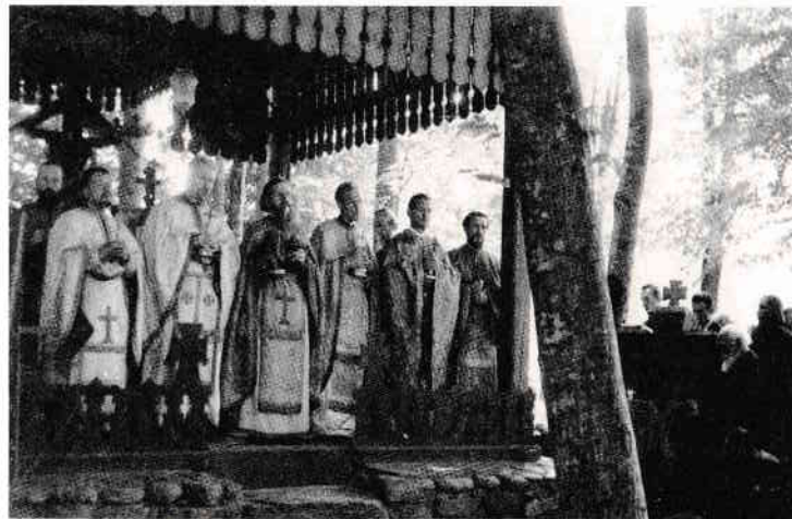
Sfântul Cuvios Serafim cel Răbdător, alături de soborul slujitor, la praznicul Adormirii Maicii Domnului, probabil 1954